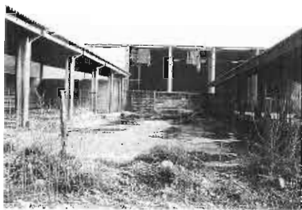
Fig. 4 - Stalla moderna abbandonata

Poco importa se nel giro di qualche anno anch'essa sarà a propria volta abbandonata perché già obsoleta (fig. 4); se non si potrà neanche pensare di riutilizzarla per lo scarso (o addirittura negativo) valore delle sue strutture; se questa soluzione, provvisoria, potrà causare altri e nuovi problemi, non provvisori, non ultimo la difficoltà di smaltire i materiali industriali con cui era stata realizzata.