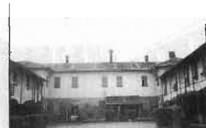
Fig. 2 - La vecchia casa padronale

Per poter parlare di recupero, l'opera edilizia finita deve assicurare il conseguimento di risultati convenienti, sia per il singolo che investe il proprio capitale nell'opera edilizia, sia per la collettività che è beneficiaria di quella cascina in senso indiretto, come parte complementare e inscindibile del suo paesaggio e della sua memoria. Di fronte ad un recupero troppo problematico, si sceglie la soluzione