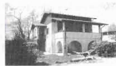
Fig. 3 - La nuova villetta in cascina