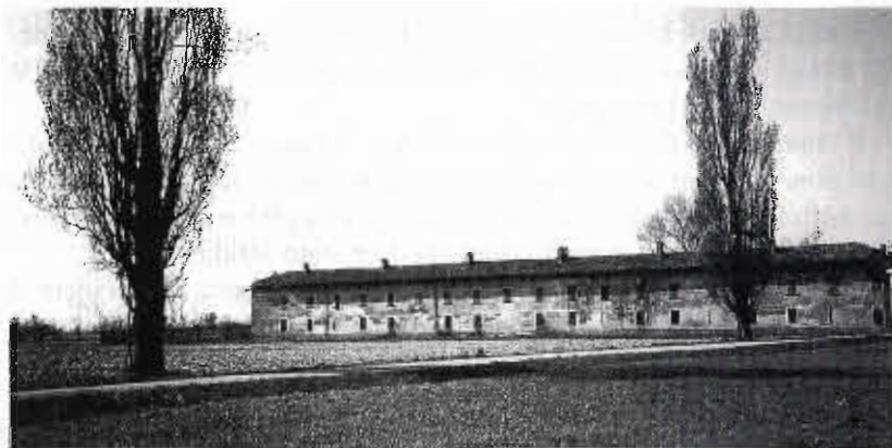
Fig. 1 - Una cascina del Parco

L'industrializzazione prima e la progressiva invasione dell'area metropolitana milanese poi, hanno rotto il rapporto di interdipendenza reciproca fra l'uomo e la terra. Le cascine, che di quel rapporto rappresentavano la sintesi perfetta, sono oggi divenute una presenza scomoda. Difficili da gestire, difficili da utilizzare, sono dai più considerate inutili vestigia di una realtà povera da dimenticare, piuttosto che una preziosa risorsa da valorizzare.